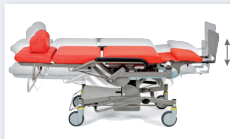
Höhenverstellung in jeder Sitz- und Liegeposition