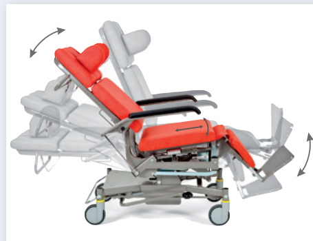
Sitzkonzept: Längenausgleich mit automatischer Sitzkantelung bei Verstellung der Rückenlehnenneigung.