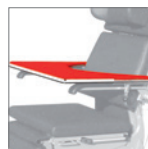
Tisch mit Polsterauflage