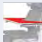
Tisch mit Polsterauflage