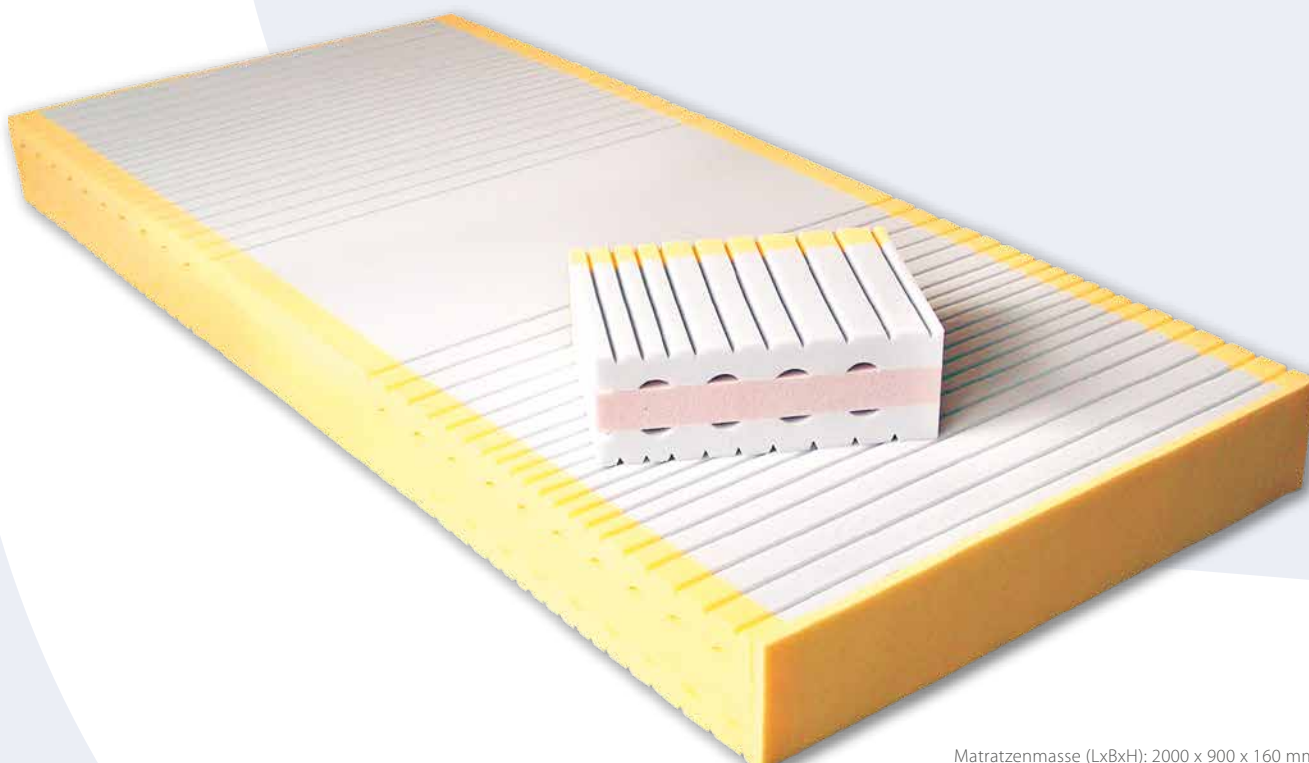
Matratzenmasse (LxBxH): 2000 x 900 x 160 mm